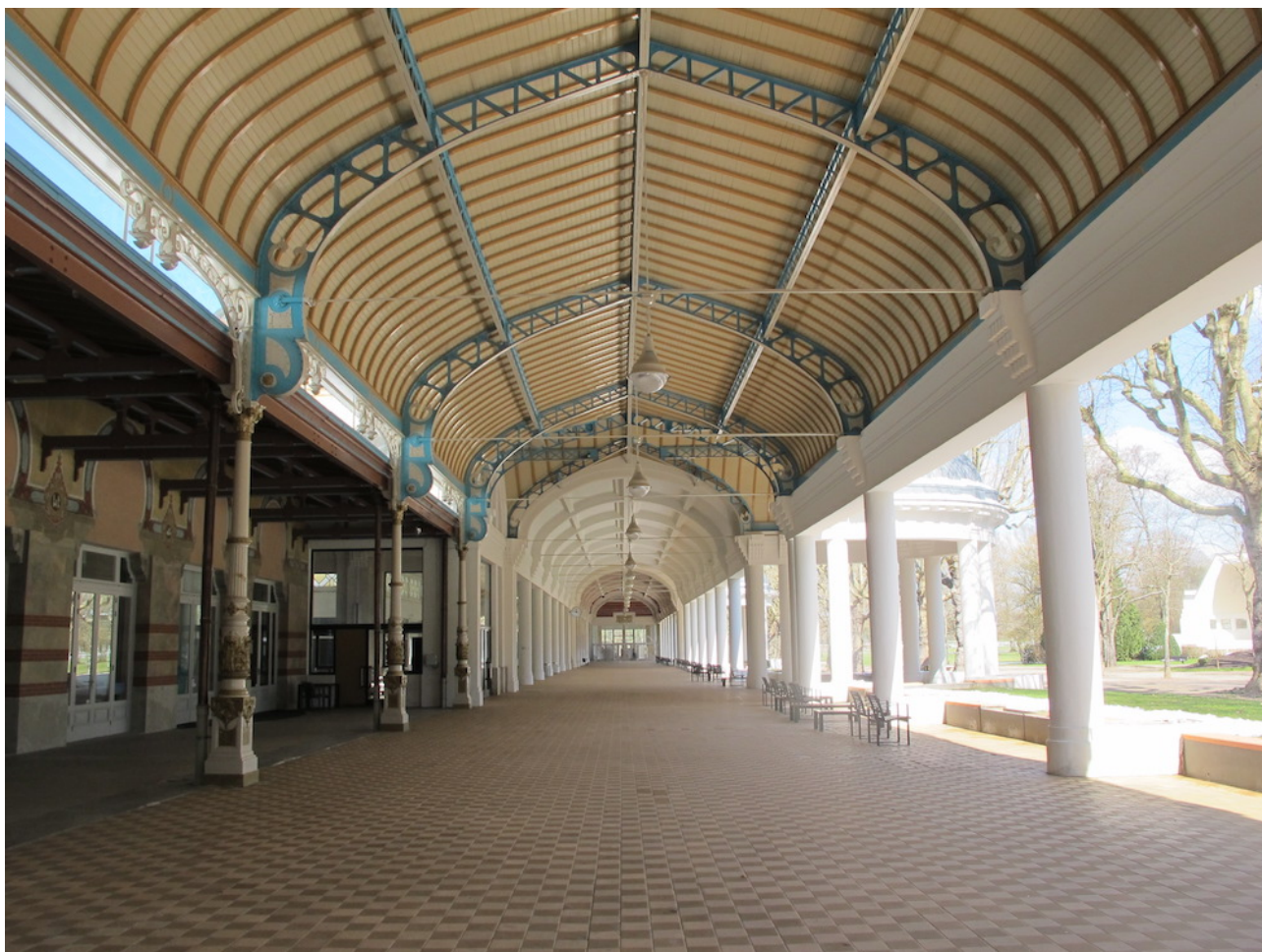
Une galerie art déco à Vittel.

Les clients se succèdent — aristocratie russe d'abord, puis oligarchie coloniale — et les bâtiments muent au gré des modes architecturales. Aujourd'hui, les allées boisées du parc thermal ont gardé un parfum suranné. Les grandes façades art déco et les fontaines rococo forment un décor de cinéma étrange. Car les rues sont désertes, les bâtiments restent vides, le golf et le casino se remplissent à peine à la belle saison. Le Club Med, qui gère la partie hôtelière depuis les années 1970, a menacé de claquer la porte ; il n'est resté que contre la promesse de la municipalité de financer un coûteux centre équestre.